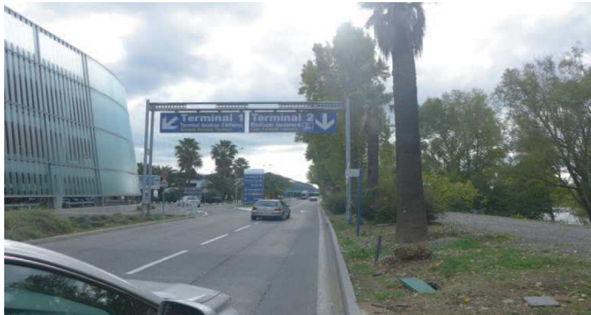
1) Aéroport de Nice Cote D'azur direction Terminal 2 / Nice Airport Azure direction terminal 2