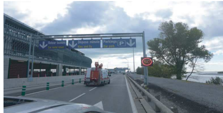
2) Suivre Parkings restez sur la droite / Follow Parking keep right