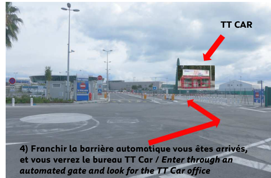
4) Franchir la barrière automatique vous êtes arrivés, et vous verrez le bureau TT Car / Enter through an automated gate and look for the TT Car office