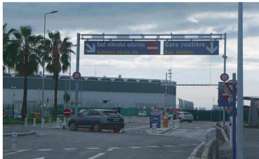
3) Suivre la direction Gare routière / Enter the restricted area "Bus station"