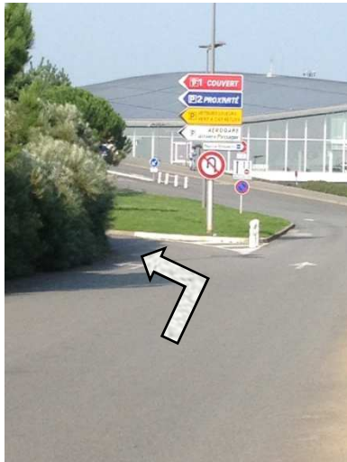
Direction P2 à gauche après le dernier rond point / Direction P2 left after the last roundabout