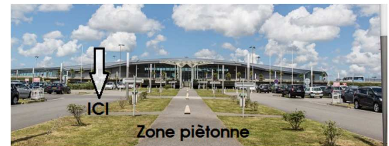
Emplacement de stationnement le long des pelouses centrales / Parking space along the central lawns