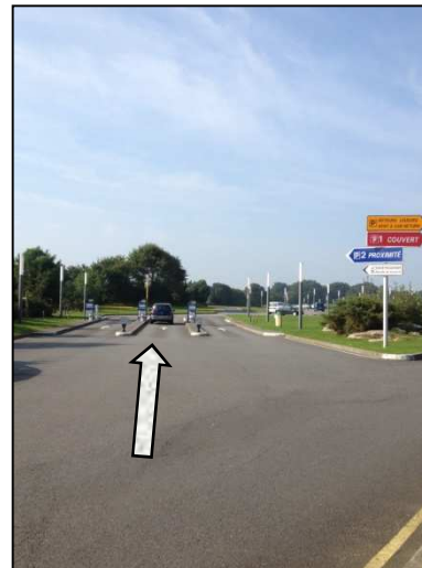
Entrée parking P2 sur la gauche / P2 car park entrance on left